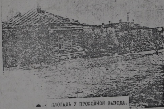
ПЛОЩАДЬ У ПРОХОДНОЙ ЗАВОДА.

Полная сметная стоимость строительства завода в неизменных ценах 1926, 1927 г.г. определялась в 7 млн. рублей, из них 2,9 млн. рублей строительно-монтажных работ.