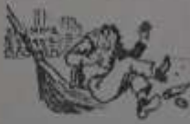
ТАКЖЕ ЗАДАЧА РАБОТЫ С ДИСЦИПЛИНОЙ

Воспитание — на первый план. В школах и учебных заведениях в этом году будет подписан коллективный договор на 1977 год, который будет заключен на 1978 год.