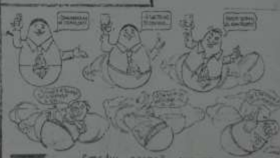
См. 101 номер за 1957 г.