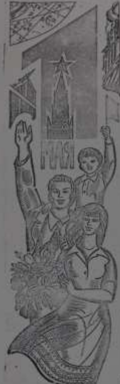
Самые лучшие работники... (text continues)