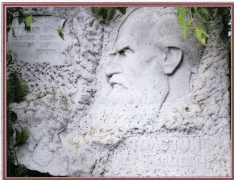
Мемориальная доска в пос. Любучаны Чеховского района

Наш адрес: г. Чехов, ул. Лопасненская, д.10.